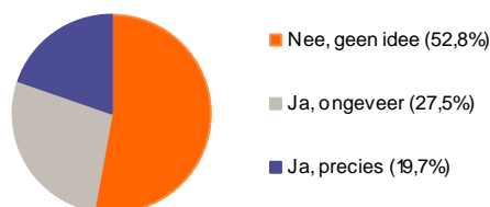
Weet u hoeveel u maandelijks aan pensioenpremie betaalt? (exclusief n.v.t.)

Bij een daling van het loon is het juist andersom. Drie op de tien (31%) zou meer uren werken, een op de acht (13%) minder. Dit betekent dat werknemers eigenlijk 'verkeerd' reageren op een loonprikkel vanuit de werkgever gezien. Bij personeelstekorten bieden werkgevers hogere lonen en willen werknemers korter werken (en durven zij eerder op sabbatical). Terwijl werknemers juist geneigd zijn om langer te werken als de werkloosheid stijgt en de lonen achterblijven.