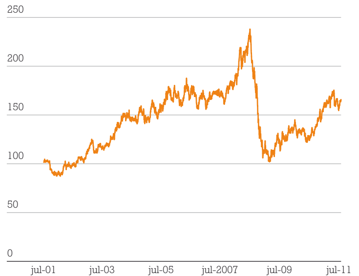
Dow Jones-UBS Commodity Index

Meer informatie over de Index kunt u vinden op www.djindexes.com .