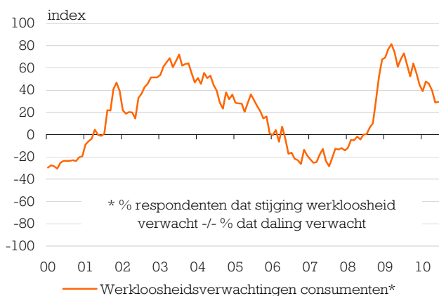
Figuur 1 Consument verwacht hogere werkloosheid