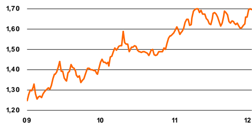
Brandstofprijzen in euro per liter

De kosten van een auto lopen harder op dan de inflatie. In totaal zijn de autokosten (exclusief afschrijvingen) de afgelopen twaalf maanden met gemiddeld 7% gestegen. Overigens is ook de afschrijving omhoog gegaan. Door de flinke prijsdaling van tweedehands auto's moeten consumenten meer bijleggen voor een nieuwe wagen.